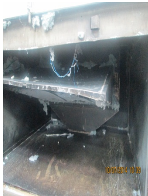
FOTOGRAFÍA 5. SISTEMA ATRAPA MOTA DE LAS SECADORAS