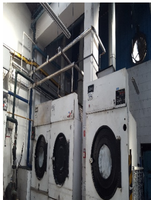
FOTOGRAFÍA 10. SECADORAS.