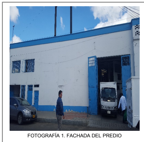
FOTOGRAFÍA 1. FACHADA DEL PREDIO