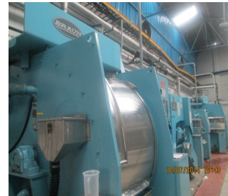
FOTOGRAFÍA 2. LAVADORAS DE LA EMPRESA