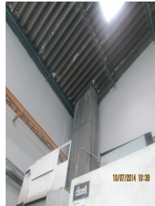
FOTOGRAFÍA 4. DUCTO DE SECADORA