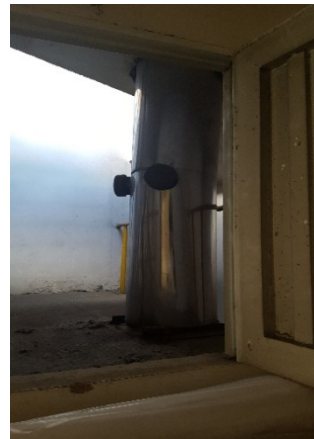
FOTOGRAFÍA 7. PUERTOS DE MUESTREO DEL DUCTO DE LA CALDERA DE 80 BHP