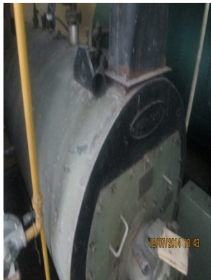
FOTOGRAFÍA 11. CALDERA DE 30 BHP.