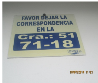
FOTOGRAFÍA 1. DIRECCIÓN DEL PREDIO OBJETO DE SEGUIMIENTO