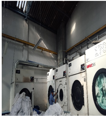
FOTOGRAFÍA 3. SECADORAS