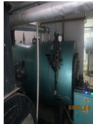
FOTOGRAFÍA 6. CALDERA DE 70 BHP