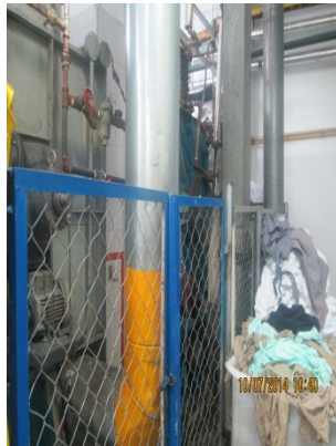
FOTOGRAFÍA 3. DUCTOS DE LAS SECADORAS