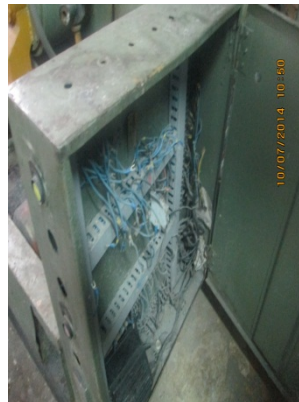
FOTOGRAFÍA 12. SISTEMA ELÉCTRICO DE LA CALDERA DE 30 BHP