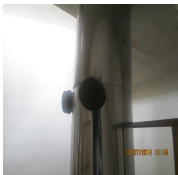
FOTOGRAFÍA 7. PUERTOS DE MUESTREO DEL DUCTO DE LA CALDERA DE 70 BHP