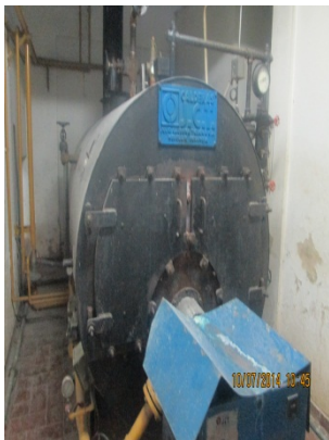
FOTOGRAFÍA 9. CALDERA DE 50 BHP.