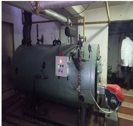
FOTOGRAFÍA 6. CALDERA DE 80 BHP