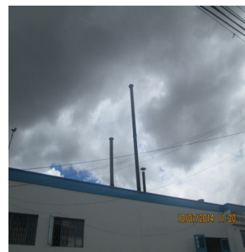
FOTOGRAFÍA 8. DUCTOS DE LAS CALDERAS