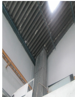
FOTOGRAFÍA 4. DUCTO DE SECADORA